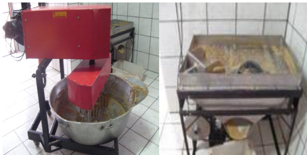
Figura04- Batedeira e peneira utilizados para a fabricação do açúcar mascavo na agroindústria Ecoçúcar, 2009.

Na sequência o açúcar mascavo foi levado para uma mesa grande, para o seu completo resfriamento, pois se embalado com umidade, pode causar diversos problemas, tais como: empedramento, ação de microrganismos e problemas na armazenagem.