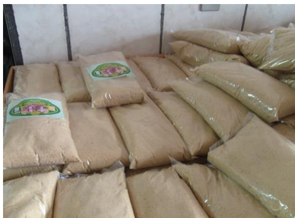
Figura 05- Embalagem do açúcar mascavo produzido pela Ecoçúcar, 2009.

Depois de feito a embalagem, os fardos de 20 kg são levados para o estoque, e os de 1 kg, quando possível , ocorre a rotulagem na hora, e após levado para o estoque (Figura 05).