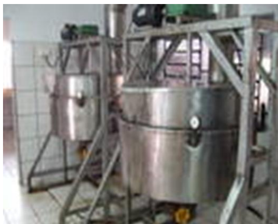
Figura 02 - Tachos de cozimento do caldo da cana para produção de açúcar mascavo na Agroindústria Ecoçúcar. 2009.

Para obter o açúcar mascavo, em primeiro lugar, é extraído o caldo da cana pela moenda e passado pelo decantador para separar os bagacilhos e as impurezas maiores, pois quanto mais limpo o caldo melhor será a qualidade do produto fabricado. Após segue para uma caixa grande em forma de um depósito, e a partir de então, para os tachos de cozimento, por declividade através de mangueiras (Figura 02).