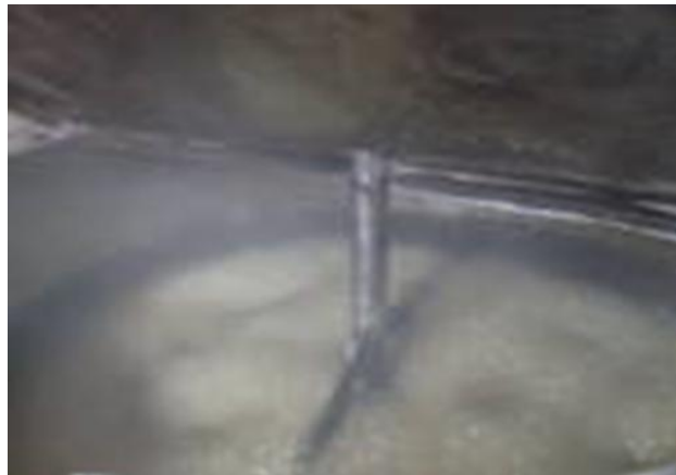
Figura 03- Cozimento do caldo da cana para produção do açúcar mascavo na agroindústria Ecoçúcar, 2009.

Para controlar a pressão de vapor dos tachos existe um aparelho chamado manômetro, o qual possui uma marcação de 1 a 5, o ideal é marcar até 3, pois passado disso o caldo pode transbordar (Figura 03).